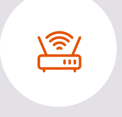
Área común con WIFI