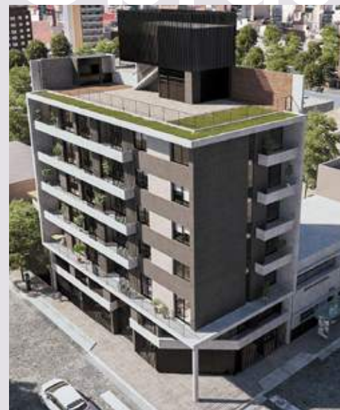
COLUMBIA Colón esq. Cochabamba. Rosario.