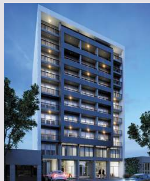
WE BUILDING Av. Pellegrini 4041. Rosario.