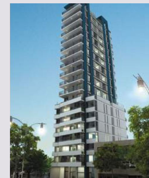
360 BUILDING Bv. Urquiza 571. San Lorenzo.