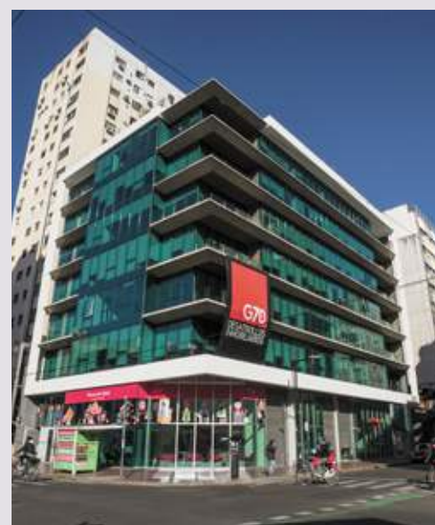
FOSS II Corrientes esq. San Lorenzo. Rosario.