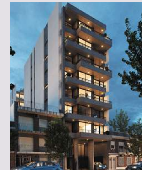
CONQUEROR JM de Rosas 1630. Rosario.