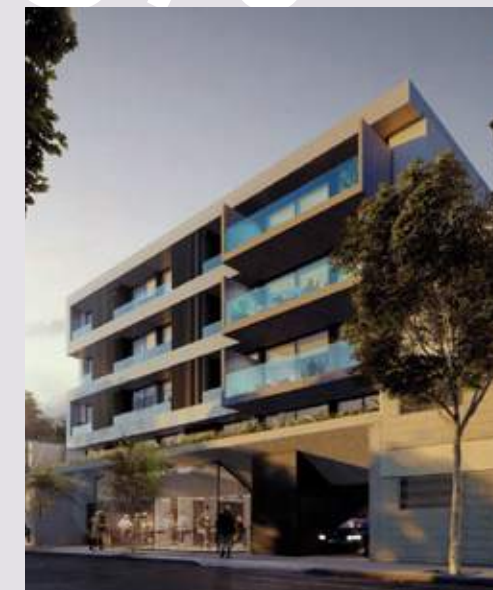
LIVINGREEN Güemes 2472. Rosario.