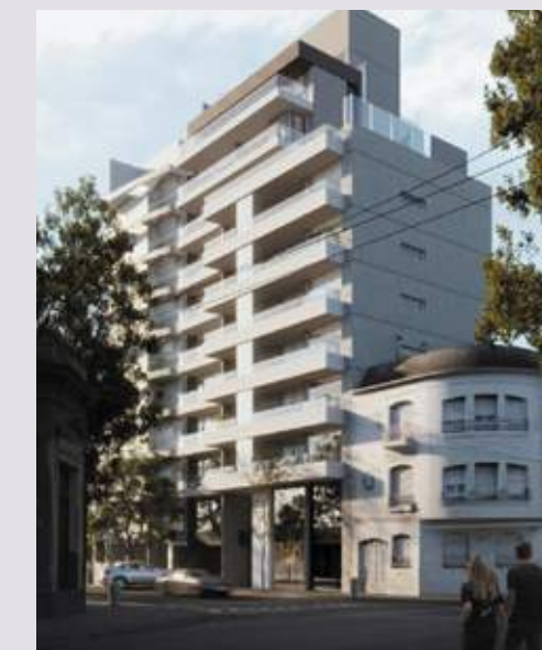
CITTÁ LUX Tucumán 2126. Rosario.